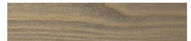
JOTUN PANELLAKK 90020 DEMPET LYSEBRUN